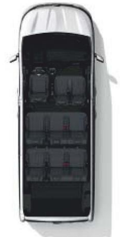
Configuration 9 places