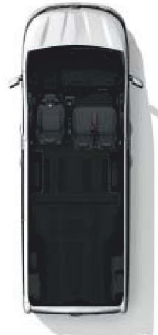
Configuration 3 places