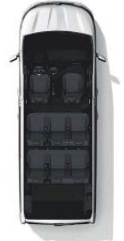
Configuration 8 places