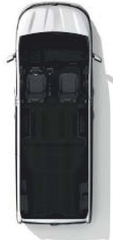
Configuration 2 places