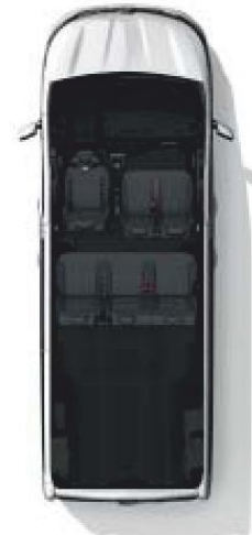
Configuration 6 places