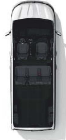
Configuration 5 places